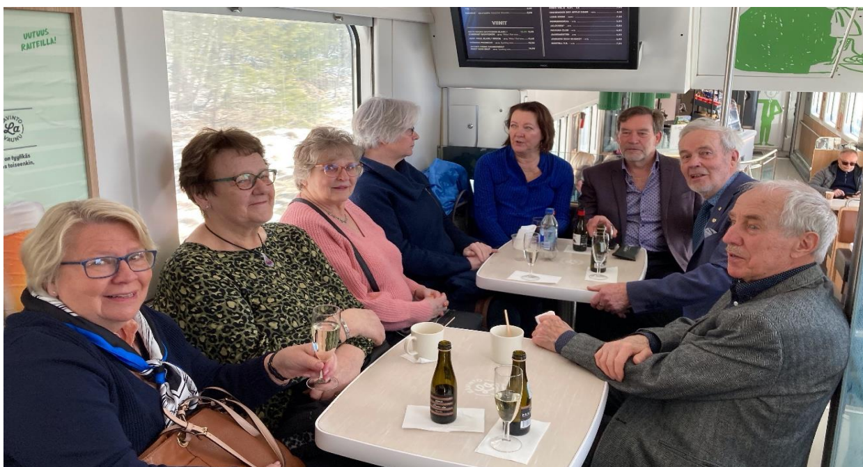
Här årsmötesdeltagare på väg till Helsingfors den 29.3.2023.